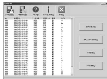
データはパソコンへ保存