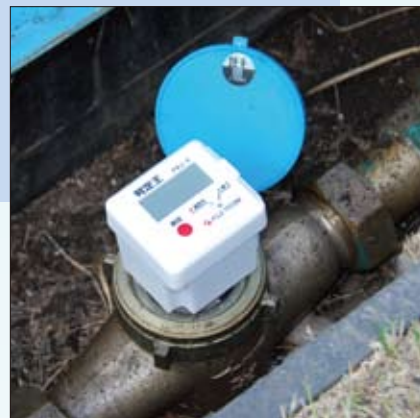
給水メーターに設置・測定