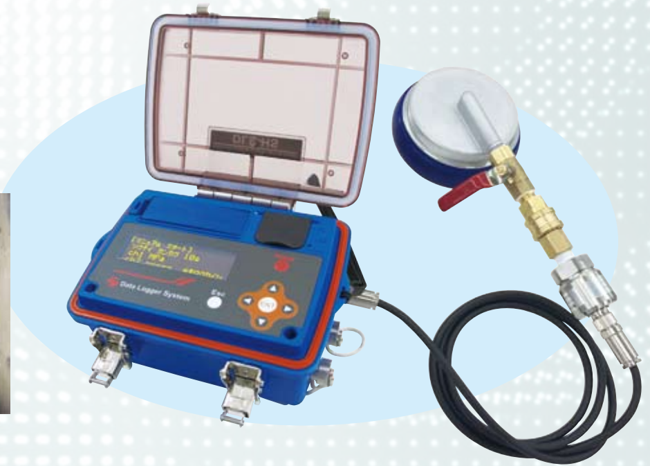
水圧・流量測定表示グラフ